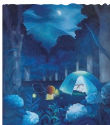
猪野 兼士 / Kenji Ino