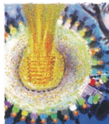
中園 晋 / Shin Nakazono