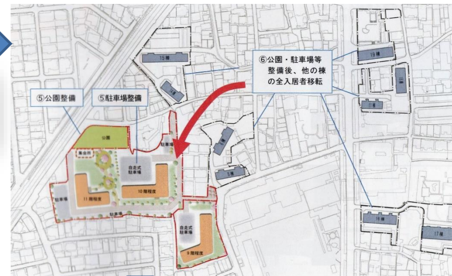
高槻市営富寿栄団地建替え基本計画案